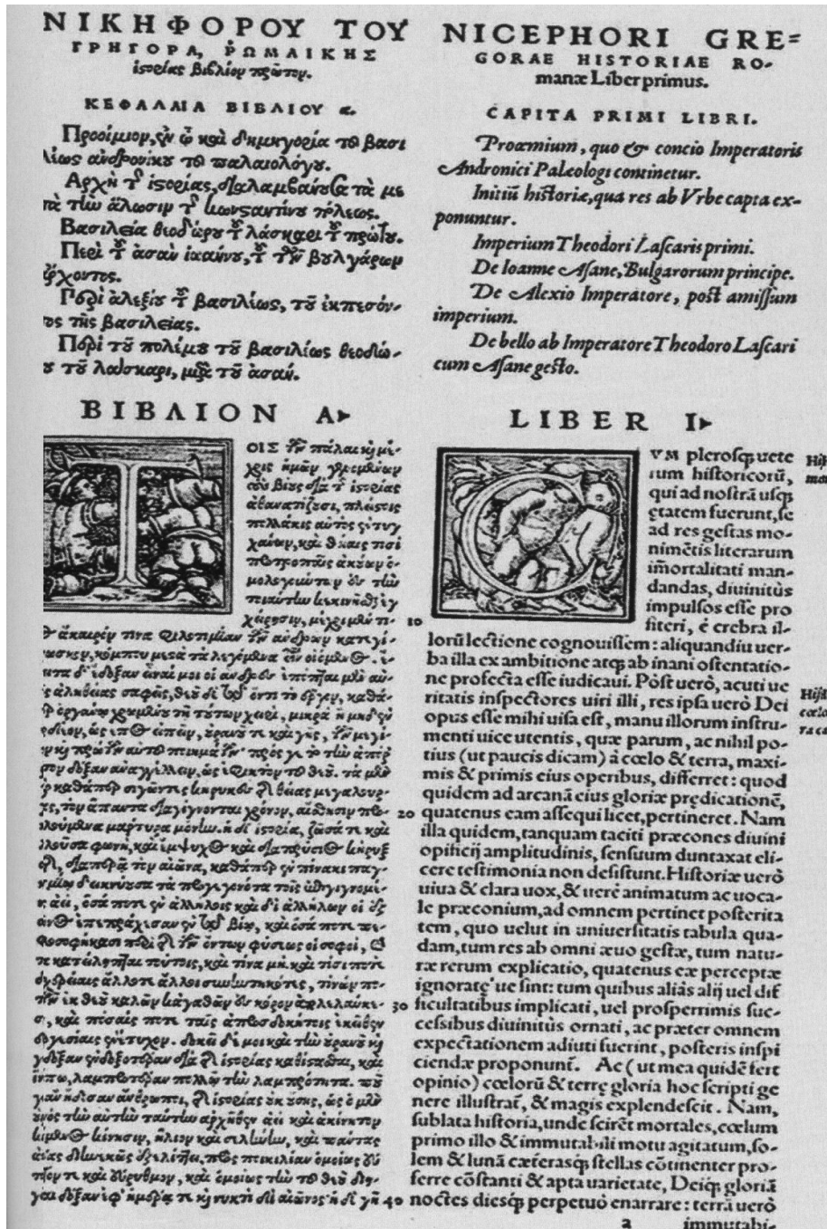
Слика 7. Двојезични (грчки и латински) текст Историје Византије Нићифора Григоре у библиотеци у Базелу.