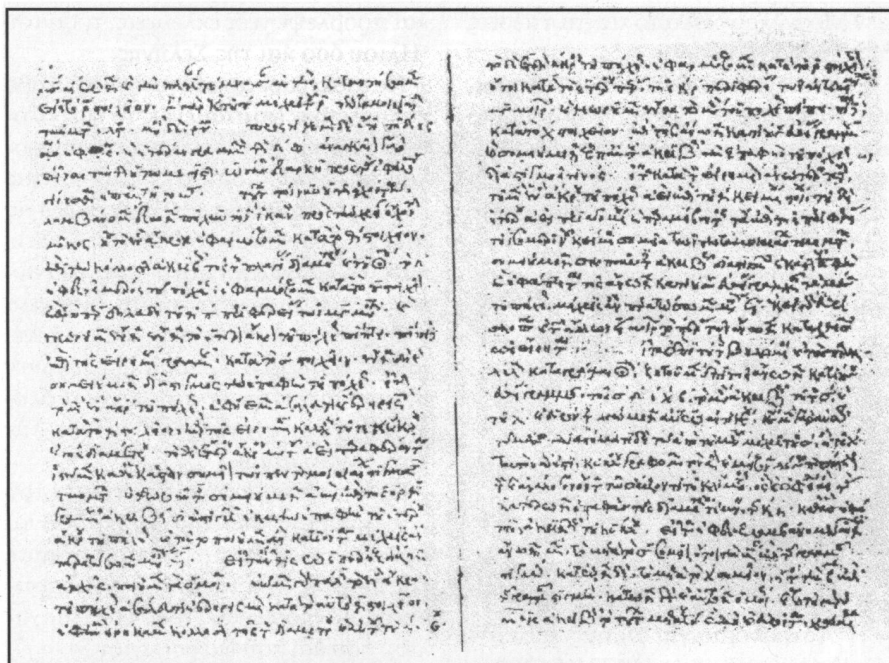
Слика 3. Из Ватиканског кодекса (Codex Vaticanus) група 318 лист 146п-147г: Нићифор Григора Како направити астролаб .

Касније, после абдикације његовог заштитника Андроника другог 1328. године, Григора је пао у немилост, изгубио имање и повукао се из јавног живота. Патријарх Константинопоља Исаија (1323-1332) поставља 1330. године Григору, како због говорничке вештине тако и због теолошког знања, на чело делегације Православне цркве, послате да учествује у дијалогу о уједињењу са Католичком. Григора се суочио са делегатима папе Јована XXII (1316-1334) не уступајући ни стопу пред њиховим захтевима за папски примат.