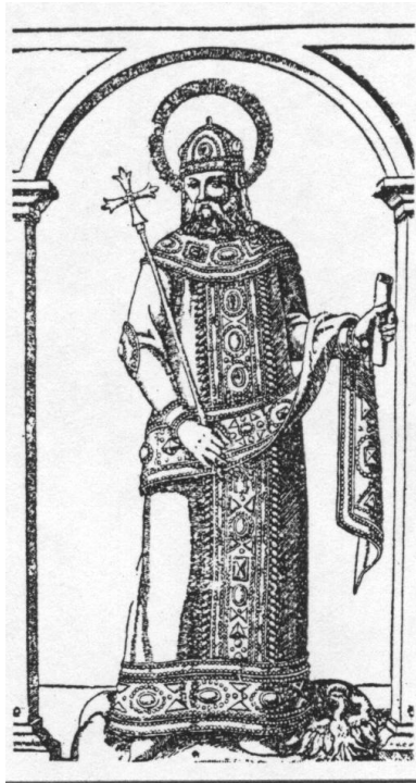
Слика 1. Цар Андроник II Палеолог.

Године 1320. Теодор Метохит је претставио свог сјајног ученика Андроника II Палеологу (1282-1328), који је, захваљујући својој вештини и интелигенцији задобио царско поверење.