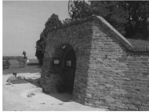
Слика 2. Улаз у Планетариум.