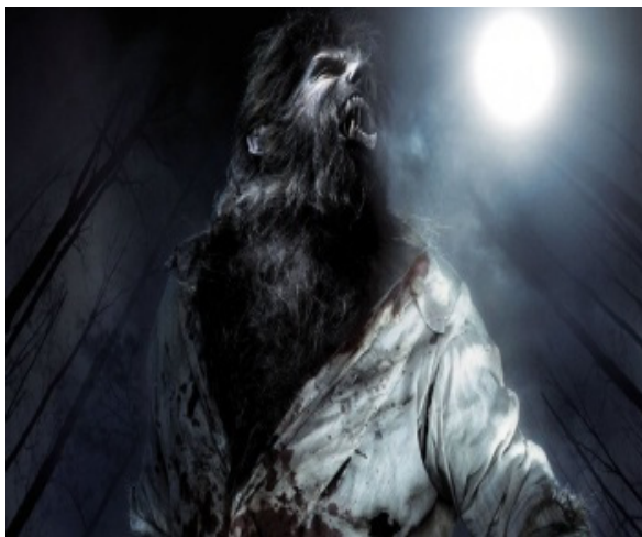
Слика 10: Модерна представа вукодлака, кадар из филма.

Вукодлаци, као митска створења, једна су од најстаријих легенди о људским чудовиштима у светској историји. О стварном извору легенде може се само нагађати. Па ипак, древни људи су се побринули да мит и фолклор о њима буде очуван до данашњих дана. Такође су познати као ликантропи, где се јединствено тело вукодлака може лако трансформисати, дајући предност слици вука. Историја вукодлака настала је независно у свакој географској регији, проширивши се готово на сва подручја планете. Вукодлаци тако постају митолошка или народна раса људи са магичном способношћу претварања у вука. Митови, везани за сазвежђа, помажу нам, такође, где да тражимо наговештаје порекла овог митског створења. Јер, све опет почиње од звезда.