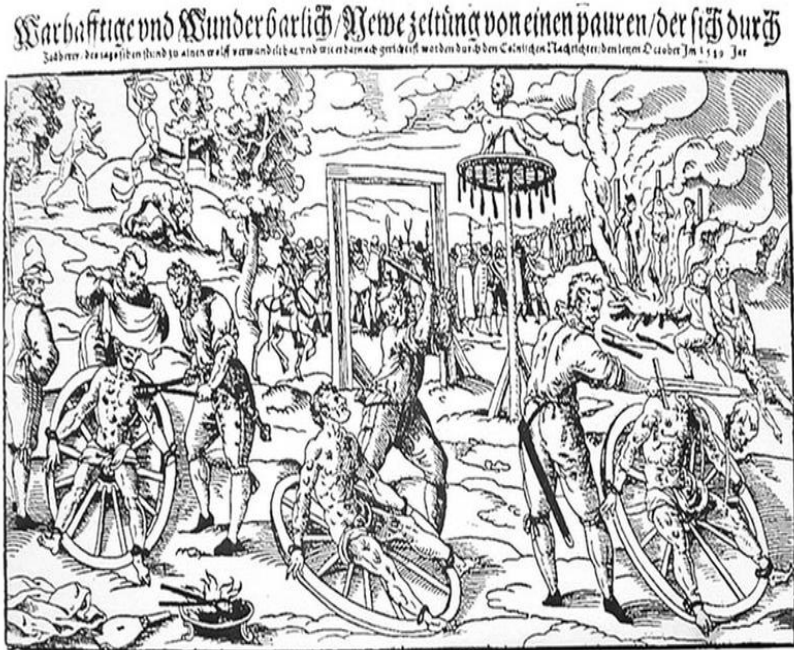
Слика 7: „The execution of Peter Stubbe“, Lukas Mayer, 1589. године.