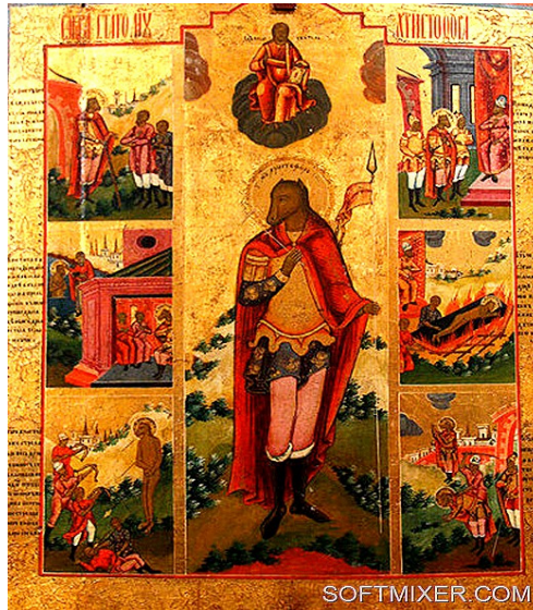
Слика 5: Хагиографска икона св. Христофора (10.век).

У причама из раног средњег века северне и западне Европе, велики витез би се случајно претворио у вука, користећи магични украс, најчешће прстен, који би му дала неверна драга, а зарад неверства. Редовник Гералд Велшки, 1185. г. записује једно од најстаријих предања о вукодлацима које потиче из Ирске. Говори о светом човеку који је у шумама Осорије легао уз ватру, а у круг обасјан пламеном ушао је „голем“ који му се обратио и рекао да он заправо није вук, него човек у вучјем обличју. Био је припадник клана Алтан, којег је проклео св. Нетан. Сваких седам година два припадника клана преображавају се у вукодлака, као што су он и његова супруга, али њу је ранио ловац, те је на самрти. Зато је вук хтео да редовник дође и удели јој посмртну помаст. Редовник је пошао до пећине где је лежала вучица, пререзао вучју кожу и угледао старију жену. На тај начин ју је одрешио од греха и она је умрла у миру. Чин преображења изазван је увек предметима са магичним својствима. Католички свештеници су те магичне моћи повезивали са Сотоном, који сваког човека ставља у искушење како би га претворио у звер. На тај начин се међу народом проширило веровање да су вукодлаци зли и повезани са врачањем (Види: https://www.britannica.com/art/werewolf ). У делу “Malleus maleficarum” („Маљ за вештице“, 1484.) забележено је да су се вештице често претварале у вука, са намером да заведу пристојне људе, а како би служиле Сотони. (Слика 6.)