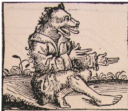
Слика 6: “Псоглав”, Нирнбершка хроника, 1493.