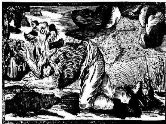
Слика 8: „Вукодлак“, дрвена резбарија, 1722.

Што се тиче арабљанских представа и идеја о сазвежђима, јако је важно рећи да они нису добијали фигуре сазвежђа повезујући имагинарним линијама сјајне тачкице на небу. Фигуре на арабљанској небеској сфери нису биле мапе, већ више слободне слике које су заузимале одређену територију и укључивале одређене звезде. То су биле или огормне фигуре које су заузимале по неколико данашњих сазвежђа, или појединачно посмартане звезде, или групице звезда. Сазвежђе Вук (Дивља звер) и Кентаур су Арабљани посматрали као једно и називали гроздом или граном пуном датула или грожђа ( al-shamarih ), јер густина звезда подсећала је на то. (Стругаревић, 2016: 181)