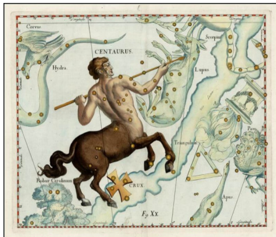
Слика 3: Грци су га звали Therion, а Римљани Bestia, што значи једноставно „звер“. Представља дивљу звер набијену на колац коју носи Кентаур, како би је жртвовао на олтару. Иконографски приказ преузет са Википедије.

О вукодлацима говоре све културе, а сконцентрисане су углавном у земљама северне и западне Европе, као и Русије. У Египту, деловима северне Африке и Блиског истока проналазимо приче о врачевима који се могу преобразити у шакала. Херодот (грчки: Ἡρόδοτος Ἀλικαρνασσεύς, 484. – 425. пре .н.е.) записао је да се Неурими једном годишње претварају у вукове, што је тумачено као празновање. Неури су највероватније били трачко племе у Трансилванији (негде у данашњем Поднепровљу), а легенде о тамошњим вукодлацима имају доста дубоке корене. (Herodot, 2000: 367) Ликаион је такође планина у Аркадији, свето месо посвећено Зевсу Ликеју (епитет Ликаиос , „вук-Зевс), а такође и место на коме се родио и одрастао сам Ликаон. Зевсов олтар на планини састојао се од велике гомиле пепела са потпорним зидом, које је потом постало место атлетских игара и архаичног фестивала, одржаваних сваке четврте године ( Ликаиа ). (видети: https://en.wikipedia.org/wiki/Lycaon_(Arcadia) )