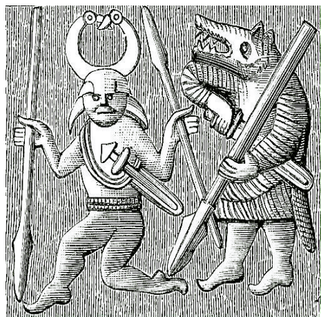
Слика 4: Вукодлак у средњовековној исландској литератури.

Са вуковима се везују и нека тајна друштва северноамеричких Инијанаца. У старим индијанским племенима (Чироки) месец без одсјаја се називао „вучијим месецом“, чији појам је везан за мистериозни астрономски догађај, где је месец мрачнији у периоду еклипсе (помрачење). Сматрало се да тада врачеве добијају обличје вука. (видети: http://www.native-languages.org/chokeee-legends.html )