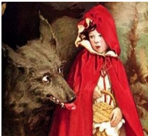
Слика 9: Црвенкапа , бајка браће Грим (прва половина 19. века ).

Grimm ), Јакоб и Вилхелм, постали су славни по објављивању збирки немачких бајки, (нем. Kinder- und Hausmärchen - „Дечје и породичне приче“) из 1812. године. Вук у бајци „Црвенкапа“ је управо визуелно и садржајно представљан као вукодлак. (Слика 9.)