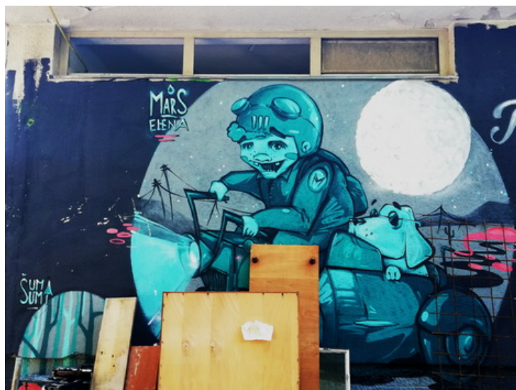
Слика 13: Шума шуми, Марс, Елена, Задар, Фото ТЛ.