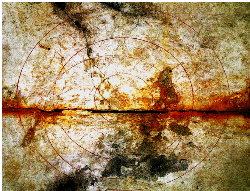
Слика 5: Китора гробница из 7-8. в. н. е, мапа неба.

У Јапану, у селу Асука, откривена је Китора гробница из 7-8. в. н. е, тумул, у којем је био сахрањен један старији мушкарац аристократског порекла. На таваници гробнице приказана је мапа неба: златном бојом насликано је 68 сазвежђа, приказано је кретање Сунца и представљена Поларна звезда у централном делу мапе.