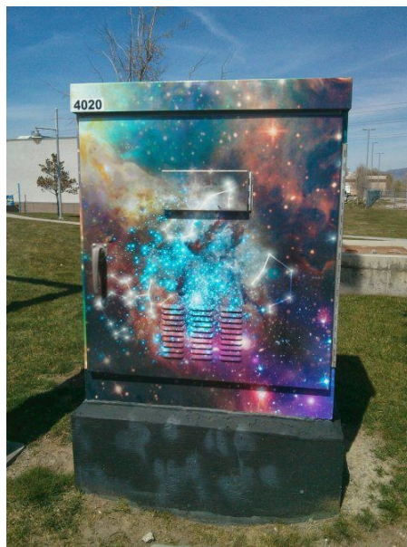
Слика 8: Art – theCHIVE.