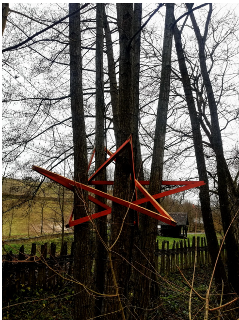
Слика 18: Тршић, Фото ТЛ.