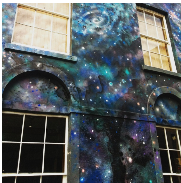
Слика 12: Галаксија, Бристол, Енглеска.