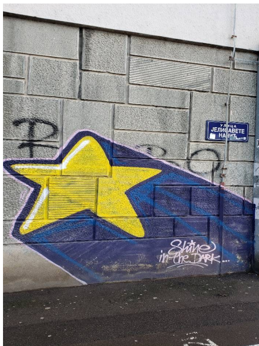
Слика 19: Јелисавета Начић, БГ.