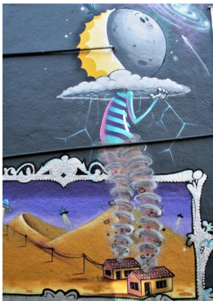
Слика 7: Еколошки графит.

Многи су уметници широм света на зидовима, оградама и плочницима показали свој доживљај, своје виђење света и космоса. Од великог броја њих, овде ћемо, због ограниченог „простора“, пренети тек понеке: