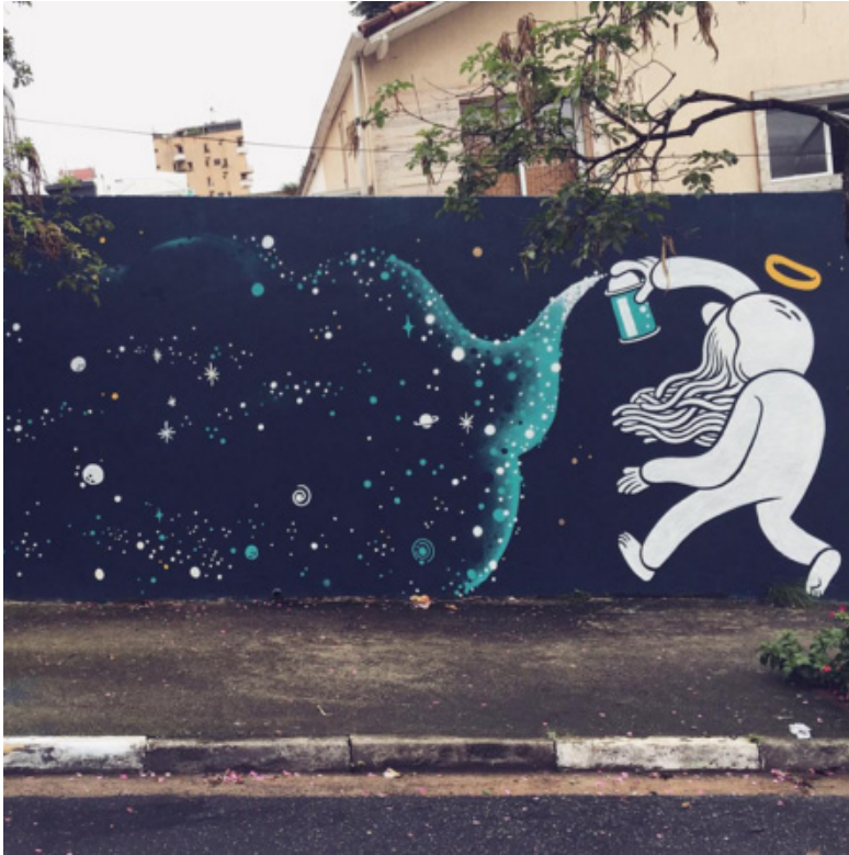
Слика 9: Звезде , Руа Фидалга, Сао Пауло, Бразил, 2016.