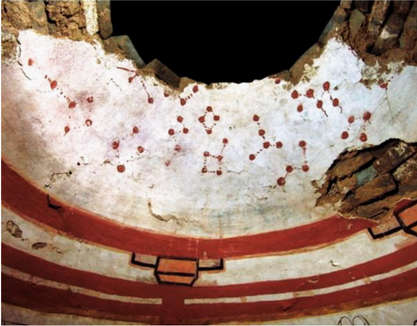
Слика 6: Датунг, гробница из династије Љао (907-1125. г. н. е.).

У северној Кини, у Датунгу, откривена је хиљаду година стара гробница кружне основе, из династије Љао (907-1125. г. н. е.). У њој је пронађена статуа висока 1 м (која је положена у гробницу уместо покојника високог ранга), цртежи који осликавају покојников свакодневни живот (путовање на коњима и камилама, приказани су ждрал, јелен, бамбус, жута корњача итд.) и таваница са детаљном мапом неба, осликана светло црвеном бојом. Звезде су правом линијом повезане тако да чине сазвежђа. 13