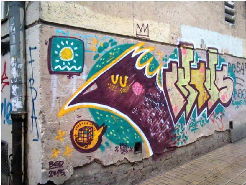
Слика 17: Бед, Београд, 2015.