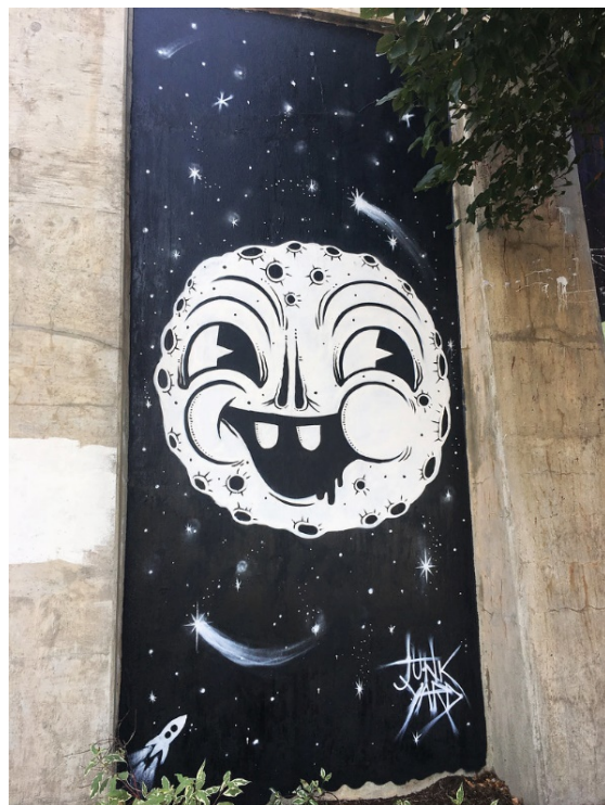
Слика 14: Цанк Јард (Отпад).