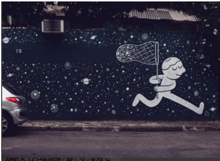
Слика 10: Мрежа пуна звезда , Сао Пауло, Бразил, 2015.