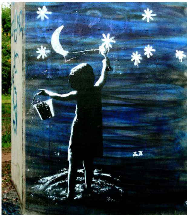
Слика 11: Модакале (Modacalle), 2012.