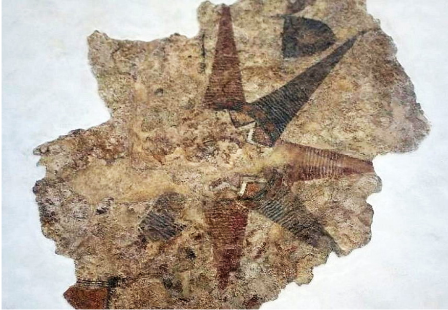
Слика 3: Гасулска звезда, 6.000 година стара.

Ова су открића, као и многа друга везана за сам локалитет, послужила као доказ да је, с обзиром да је светилиште подигла група сакупљача хране, организована религија могла настати пре пољопривреде и других видова цивилизације.