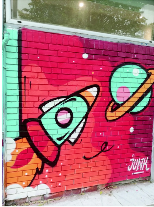
Слика 16: Јунк, Ракета, Божидар Ације, Београд, Фото ТЛ.