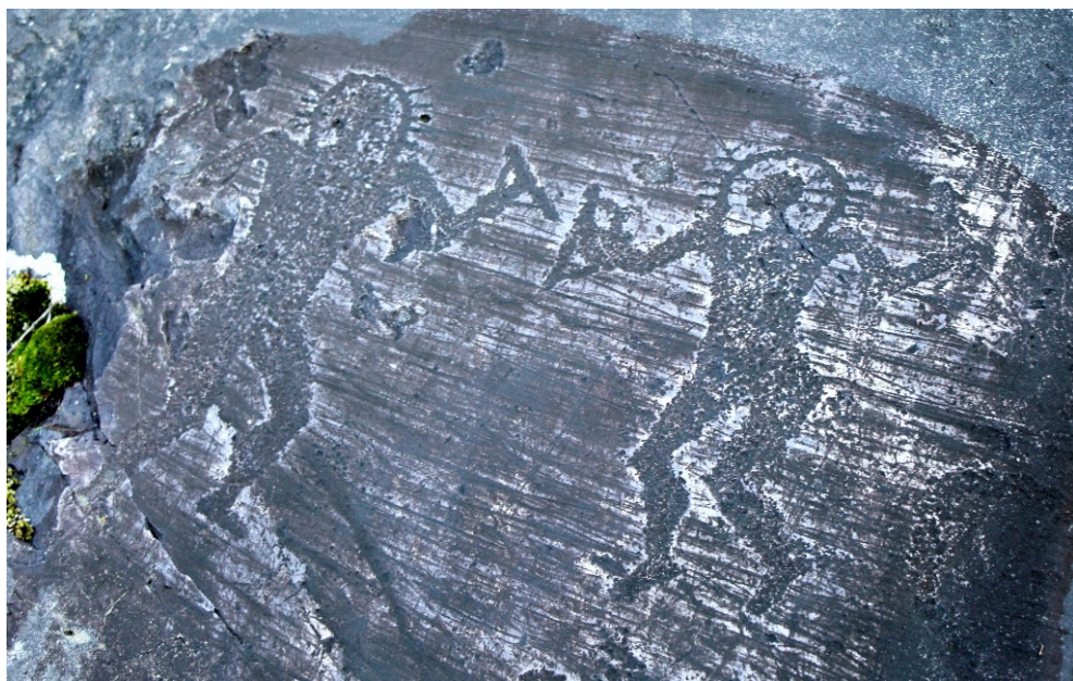
Слика 4: „Астронаути“, Камоника долина, 1000. г. п. н. е.

За Камоника долину везује се највећи број петроглифа (цртежа на стенама, изведених сликањем, гравирањем, гребанњем или дуборезом), пронађених у свету. Откривено их је преко 200.000, односно 300.000. Најстарији петроглифи настали су пре 15.000 година. За нас најзанимљивији, са приказом „астронаута“, настао је око 1000. г. п. н. е.: