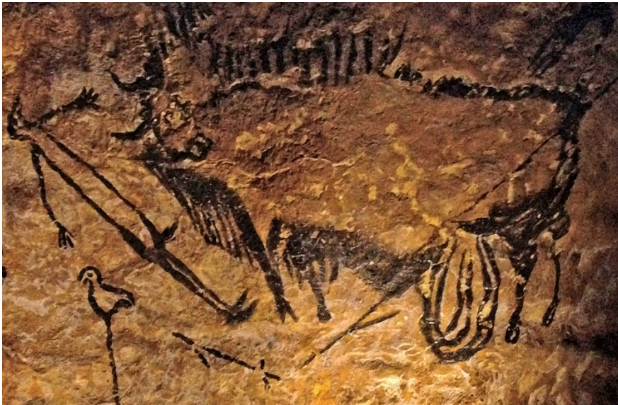
Слика 1: Ласко, удар комете 15.200 г. п. н. е.

Археолози су, не тако давно, открили да пећинско сликарство (које се појавило пре око 35.000 година и повезује се са савременим људима), 1 не приказује само животиње које је човек у то (пра)давно доба ловио, већ да многи цртежи представљају древне мапе неба, приказе сазвежђа. 2