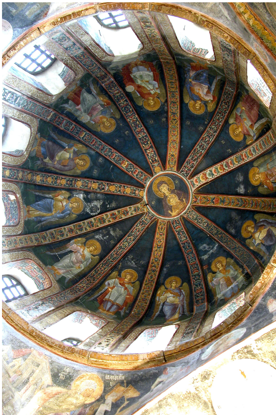
Слика 4 а.