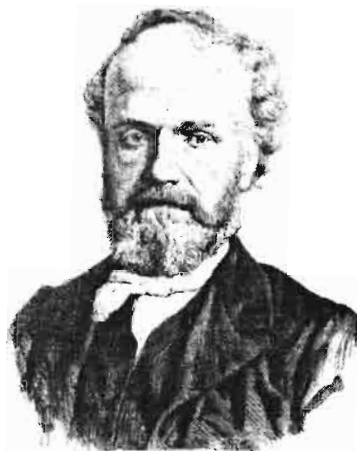
Сл. 1 Жил Жансен. Објављено у часопису L'Illustration , 1873, поводом његовог избора за члана француске Академије наука.