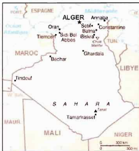
Сл. 8. Мапа Алжира са положајем града и оазе Бискра