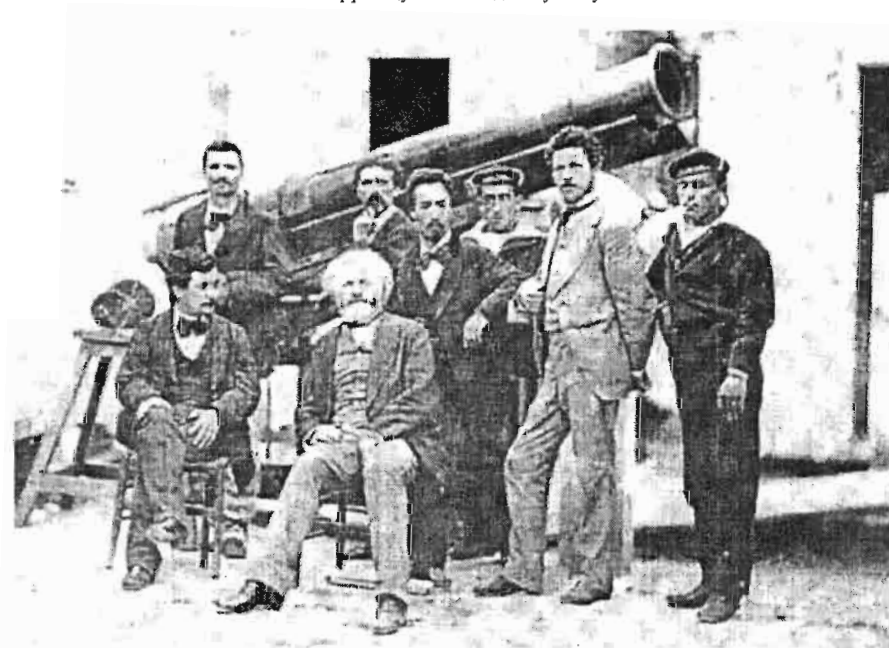
Сл. 2 Жил Жансен (седи у средини) у Јапану 1874. због посматрања проласка лика Венере преко сунчевог диска. Његов „фотографски револвер” је на крајњој левој страни фотографије.