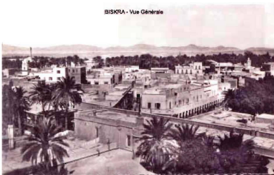
Сл. 9. Бискра у време Ђорђа Станојевића

Станојевића је Жансен позвао и да му се придружи у експедицији у алжирску оазу Бискра (Сл. 8, 9), где је намеравао да проучава Сунчев спектар близу хоризонта, да би истражио утицај Земљине атмосфере на њега, посебно телурске линије. Експедиција је трајала четири и по месеца крајем 1889. и почетком 1890. године. Жансен је овај подухват