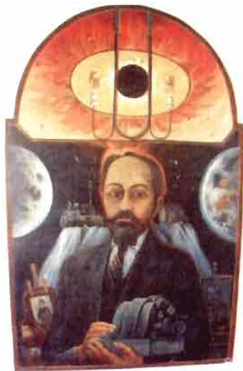
Сл. 3. Портрет Ђорђа Станојевића, који је насликао Милић од Мачве, у Станојевићевој Спомен-соби у Неготину

За члана француске Академије наука изабран је 10. фебруара 1873. Тим поводом у часопису L'Illustration објављен је његов портрет приказан овде на Сл. 1.