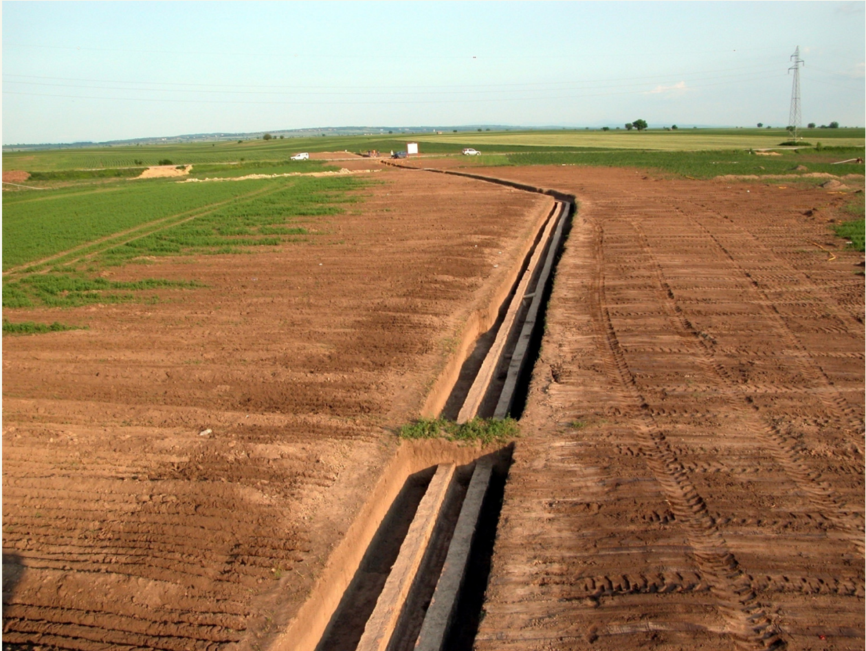
Abb. 2. Die Wasserleitung Viminaciums.

Im Jahr 2003 wurde mit Hilfe von Georadar ein Teil der 1,5 km langen römischen Wasserleitung entdeckt und vollständig ausgegraben (Abb. 2). 5 Durch die Untersuchungen der darin enthaltenen Ablagerungssedimente konnte man viele Erkenntnisse über die chemische und bakteriologische Zusammensetzung des Wassers, sowie über seine ehemalige Fließgeschwindigkeit innerhalb der Leitung gewinnen. Da die Leitung sehr nah am Tagebau lag, musste sie in Segmente geschnitten und wegtransportiert werden. Wahrscheinlich war die gesamte Länge des Aquäduktes mit Steinblöcken bedeckt. Die Konstruktion selbst bestand aus Ziegeln, die mit wasserdichtem Mörtel verbunden waren. Auf diese Weise leitete man frisches Wasser aus den rund 20 km östlich gelegenen Bergen, wo es auch heute noch mehrere Quellen gibt.