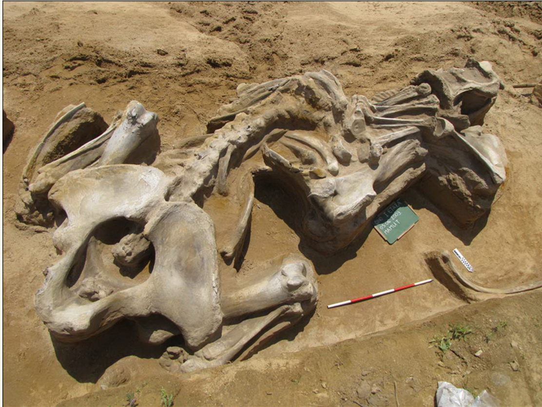
Abb. 6. Das Mammutskelett.

Pferde- und Bisonknochen, sowie Knochen weiterer Säugetiere aus der Eiszeit entdecken. Anders als die gut erhaltenen Knochen des ersten Mammuts „Vika“, das man 2009 in Sedimenten des Vormoravatales entdeckt hatte, waren die Knochen der in Nosak entdeckten Mammute in schlechterem Zustand. Alle Knochen wurden unter großen Anstrengungen ausgegraben und zum Teil als Blockbergung in den archäologischen Park Viminacium transportiert. Hier sollen sie in einem großen paläontologischen Museum ausgestellt werden, dessen Konstruktion vor kurzem begonnen hat.